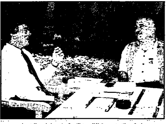
ولي العهد الاردني مستقبلا للبعوث الامريكى في عمان اس